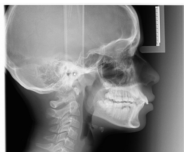
RX DEL CRANIO LATERALE